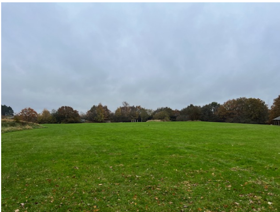
Udsyn fra stien med mod Tueholmsøen.