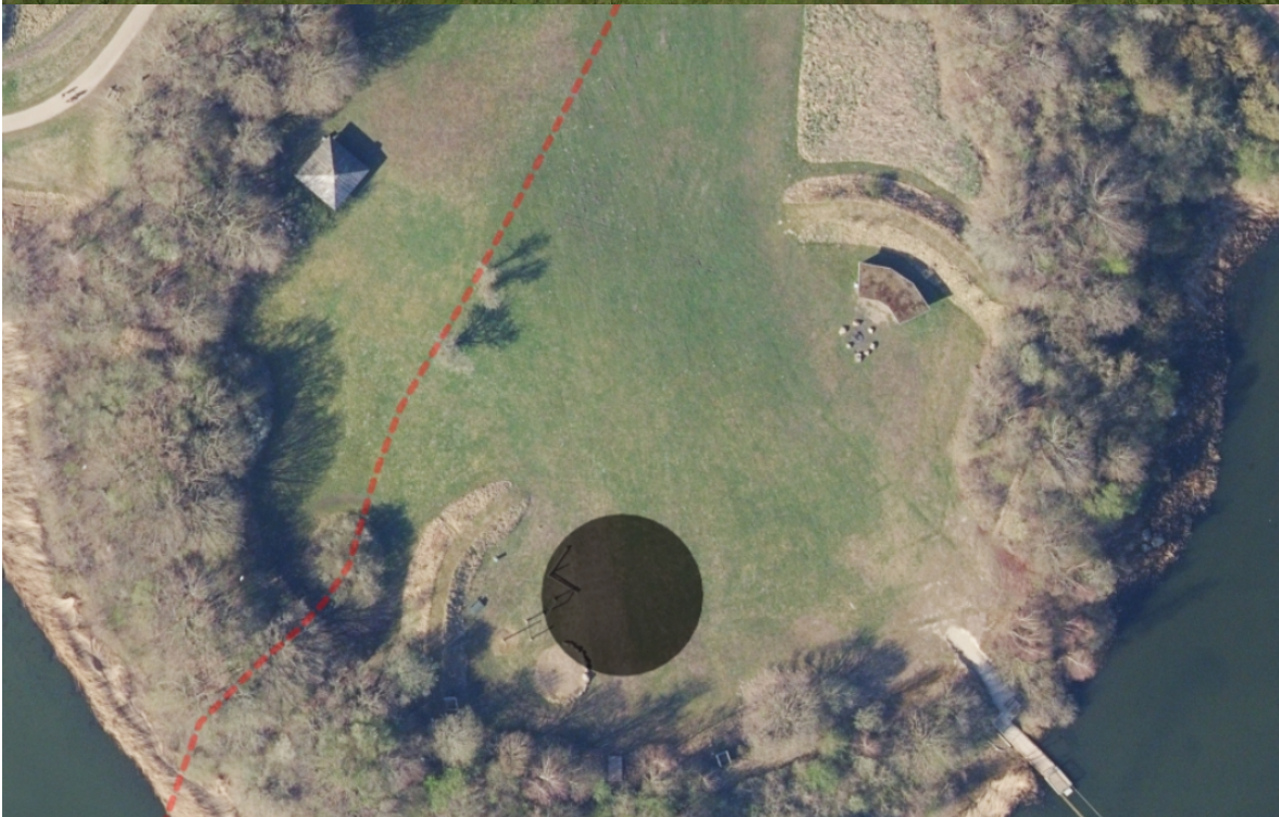
Placeringen af den nye legeplads, som vil ligge ca. samme placering som den eksisterende legeplads, der bliver fjernet.